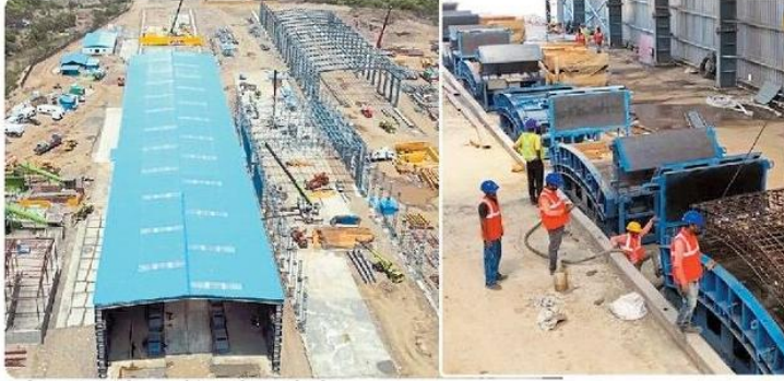
कास्टिंग और स्टैकिंग यार्ड में कार्यरत कर्मचारी।

यार्ड में सांचों के नौ सेट होंगे, जिनमें से प्रत्येक में दस सेगमेंट होंगे। इन सांचों के चार सेट पहले से ही साइट पर इनस्टॉल किए जा रहे हैं। यार्ड कास्टिंग संचालन को स्वचालित और मशीनीकृत करने के